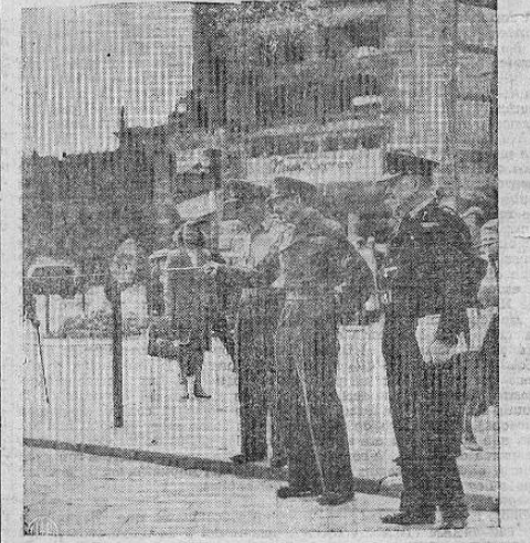
OFICIALES BRITANICOS EN BERLIN — El mayor general E. O. Herberti (centro) Gobernador militar de Berlín, acompañado del Teniente Coronel J. Corbett vice preboste militar y del Director de Seguridad Pública, coronel Whittle, inspeccionando fronteras de los sectores rusos y británicos cerca de la plaza Potsdamer.

Los agricultores de las zonas afectadas en el país por las mangas de chapulin están deseosos que el Ministerio de Agricultura se apresure a incrementar una fuerte y verdadera campaña de exterminio del terrible animalito que efectivamente pueda salvar a la producción nacional de la amenaza que contra ella se cierne.