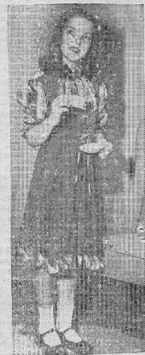
RAYON RARO — A esta niña le gustó vestirse en trajes de otras épocas luciendo un traje de tífeta plizada de rayón que le da un aspecto moderno.

Aprovechamos la grata oportunidad para testimoniar a la honorable señora de Zúñiga nuestro más atento saludo y nuestros sinceros votos por que su permanencia en esta capital recorra las más gratas impresiones.